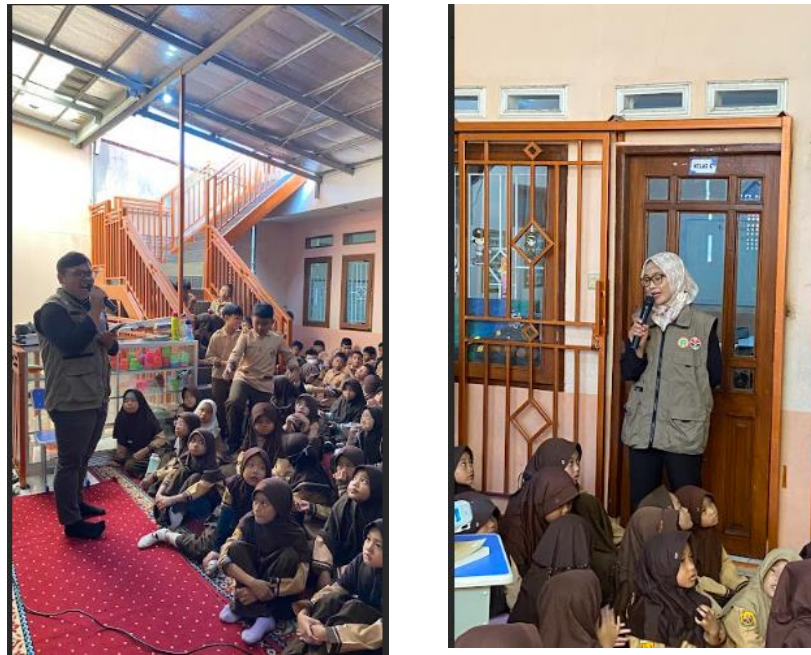
Gambar 2. Dokumentasi Kegiatan Penggunaan Media Audiovisual

Total 41 anak melengkapi kuisisioner pre-test dan post test dan berpartisipasi pada kegiatan pengabdian kepada masyarakat dengan mengikuti secara lengkap dari awal sampai akhir. Kegiatan edukasi berlangsung selama dua kali pertemuan pada Jumat, 13 September 2024 dan satu minggu selanjutnya pada Kamis, 19 September 2024 pada jam 08.00-11.00. Kegiatan dimulai dengan pembukaan oleh pembawa acara, sambutan dari Kepala Sekolah, diikuti dengan quiz, pembagian kuisisioner pre-test dan kegiatan inti adalah penayangan media audiovisual, materi melalui power point mengenai bullying diikuti dengan diskusi dan pembahasan setelahnya. Siswa aktif mengikuti kegiatan dan aktif membahas video yang telah ditonton.