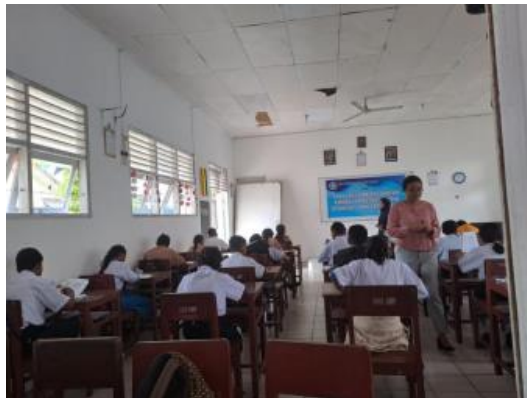
Gambar 2. Prosesi Pemeriksaan Psikologis (Tes IQ dan Kepribadian)

Kegiatan pengabdian masyarakat ini berfokus pada pemeriksaan psikologis pasca konflik yang dialami oleh siswa di SMP Kristen Rehoboth. Umumnya mereka yang bersekolah di sekolah tersebut adalah mereka yang terdampak konflik antara daerah (Kariu dan Pelauw). Kegiatan pengabdian masyarakat ini dilakukan secara luring dengan berinteraksi langsung dengan peserta. Peserta yang mengikuti kegiatan tersebut adalah 58 peserta didik.