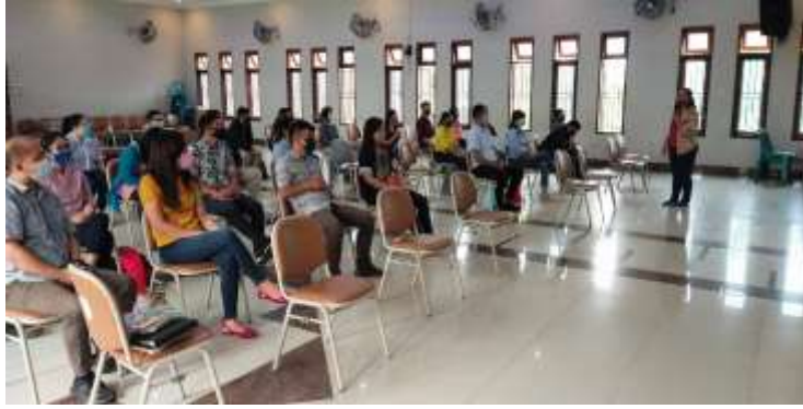
Gambar 1 : pemaparan materi Pendampingan Konseling Tentang Seksualitas Dan Keluarga Berencana Alami (Kba) Dalam Perkawinan Katolik Pada Calon Pengantin Di Gereja Katolik Ratu Rosari Tanjung Anom