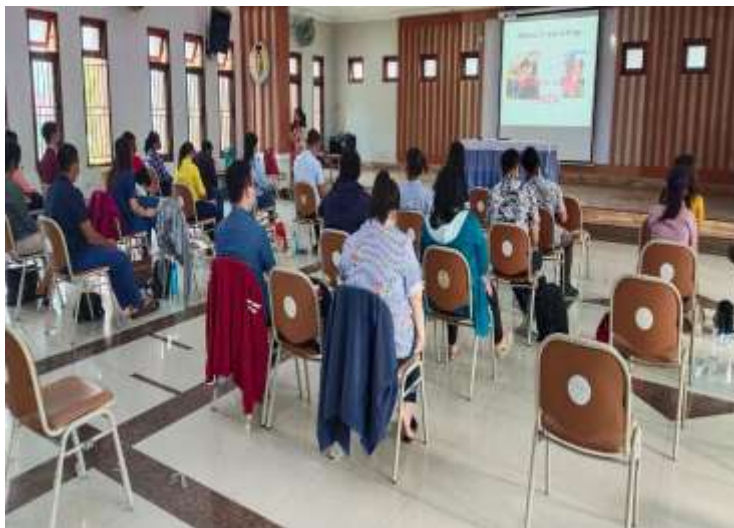
Gambar 2 : foto kegiatan PKM