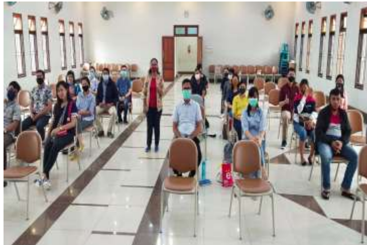
Gambar 6 : foto bersama calon pengantin