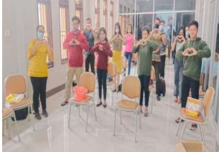
Gambar 4 : foto bersama calon pengantin